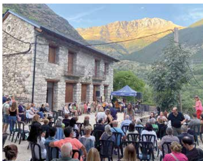
Concert amb Lo Martí de Térmens i la Vall Fosca Street Friend's Band