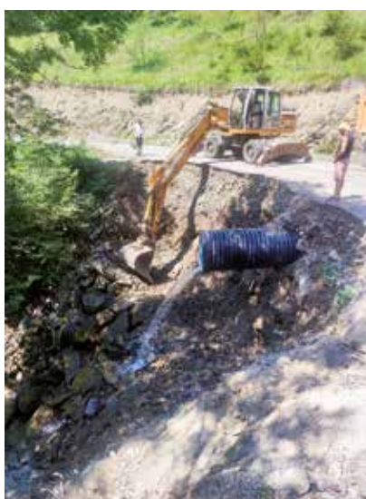
Reparació desperfectes del barranc d'Aguiró