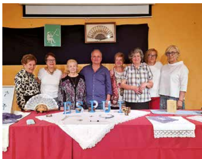
Trobada de puntaires a Espui