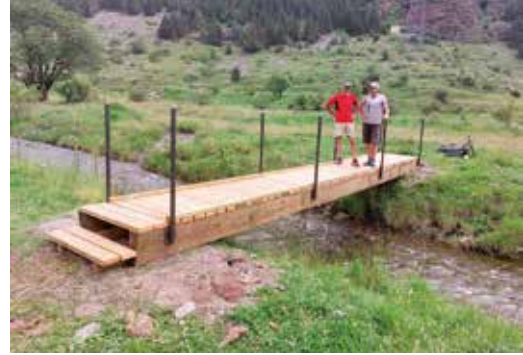
Construcció d'una passarel·la al pla de Toveria