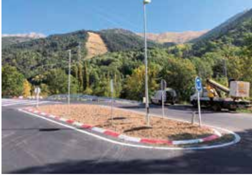
Adequació de l'entrada a Espui amb una illeta transitible