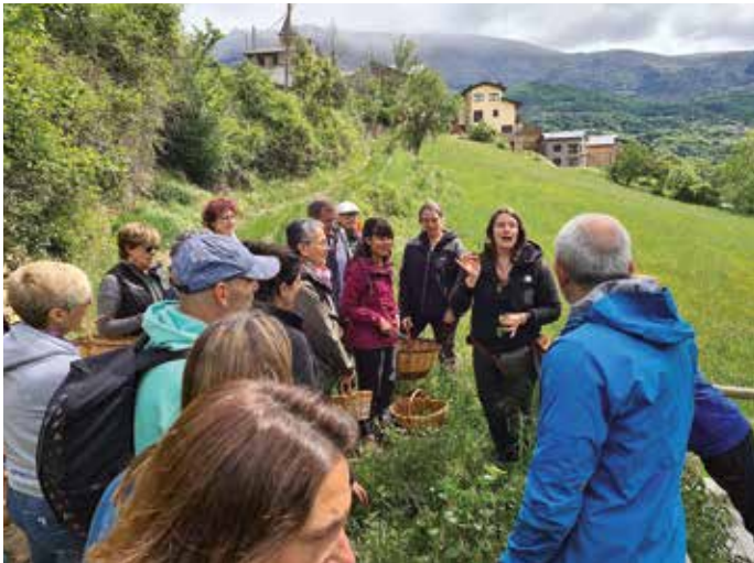
Taller: Com recollir i preservar plantes medicinals

hem gaudit d'espectacles, activitats a la natura, música... Us en deixem una mostra fotogràfica.