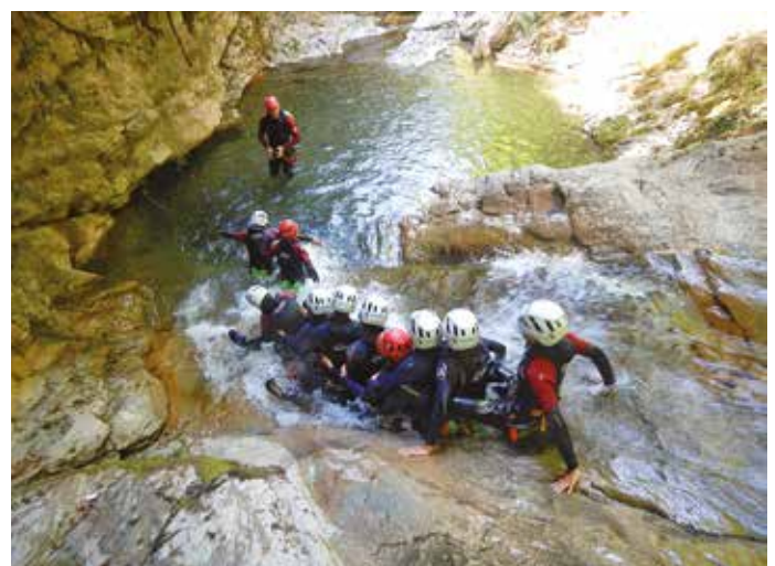
Coneguem els nostres barrancs