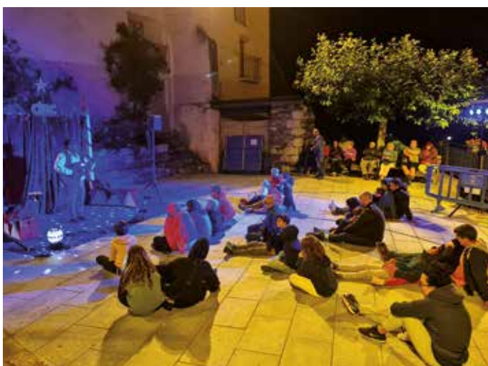
Espectacle familiar: Explica'm un circ