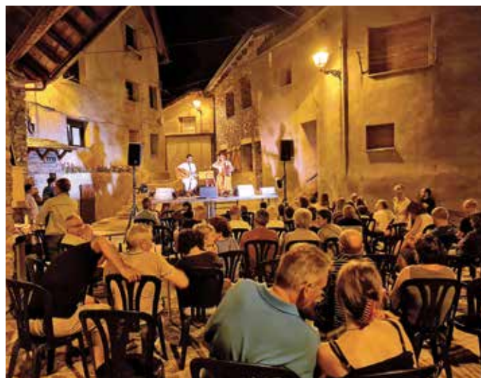
Festifolk Vall Fosca