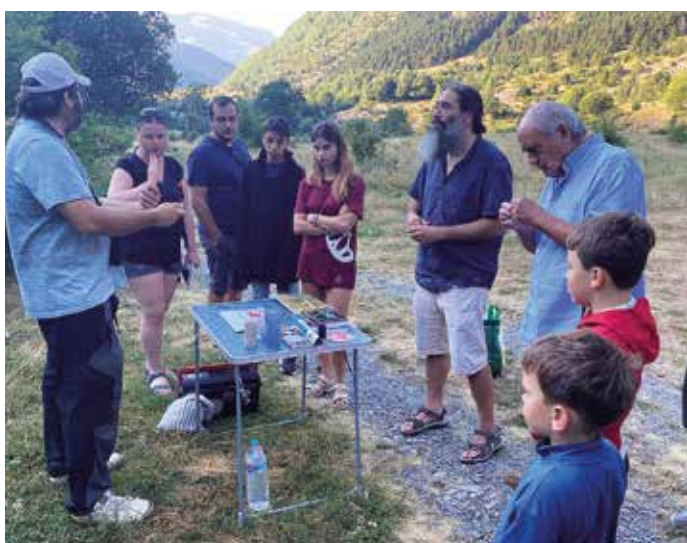
Anellament d'ocells en família