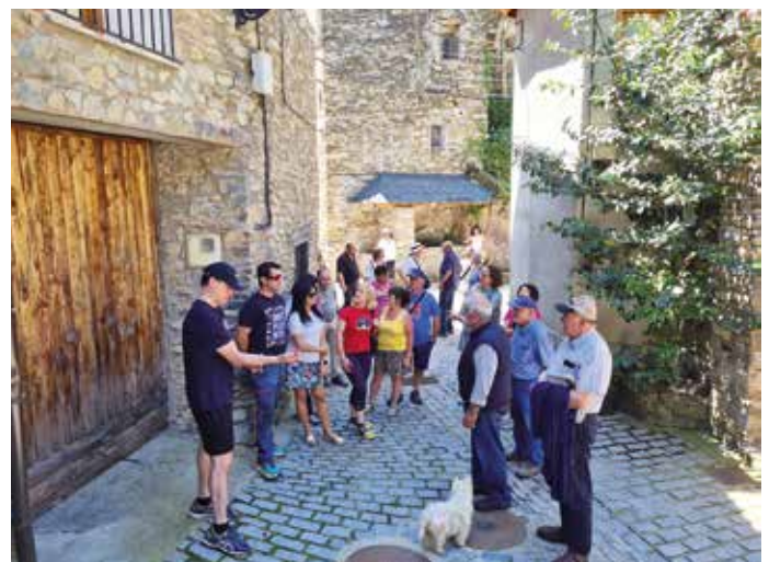
Visitem la Torre de Capdella