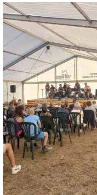
Demostració de matalasser, forjadora i ferrador, i concert amb el grup Folkimanxa

La fira va comptar també amb demostracions d'oficis (puntaires, sabó de casa, matalasser, terrissaire, forjadora, telera, ferrador), tast de freginat i mostillo realitzat per veïns i veïnes de la Pobleta, una exposició de pessebres a l'església a càrrec de Frederic Sancho de l'Associació pessebrista de Vilanova i la Geltrú, i l'exposició fotogràfica "L'Albert de les Egües" de Pere Montiel. Durant el cap de setmana vam poder gaudir de música tradicional als